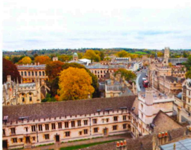
牛津也是港人移英熱門城市，內有不少高等著名公立及私立中小學。