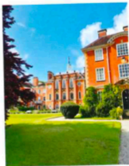
若選擇私立學校，英國一年學費、住宿及生活費，預算大約需30萬至50萬港元。

如果以BNO「5+1」移民方法學家到英國生活，若為小朋友選擇入讀當地的公立學校，便不用繳交學費及書簿費，至於大部份英國小學的Year Reception至Year 2均提供免費午餐。如果選擇私立學校，英國一年學費加生活費，預算大約30萬至50萬元不等，主要視乎所到地區而定。