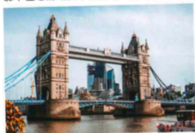
移民英國後，無論居住及學習環境也得重新適應。

語境會令孩子有點吃力。聽不懂老師或同學的對答，亦未能好好完整表達。「一年過去情況已大大改善，他們有自己的朋友，上課也大致能掌握老師所講的內容。作為父母的，開始時要多陪伴、觀察及了解他們的適應。」