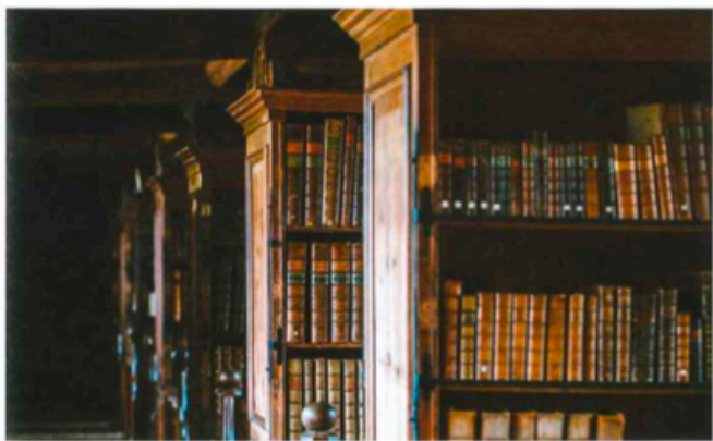
英國學術氣氛濃厚，為此不少香港家長都希望安排子女到英國升學。

英國於 2021 年初開放 BNO「5+1」移民方案，令本港移民英國的人士持續上升。早前，財富管理公司瑞達國際透過向英國護照署自由資訊 (Freedom of Information) 查詢相關資訊，結果發現於 2019 年及 2020 年期間，總共有超過 460,000 本 BNO 獲簽發，數目遠高於之前三年的總和。其中 BNO 護照簽發的高峰期為 2020 年秋冬季，平均數量為每月 50,000 份。此外，英國內政部資料顯示，截至 2021 年 9 月第 3 季，約有 24,000 人申請 BNO 簽證，首 3 季累計數字已增至 88,000 人，獲簽證則有 76,176 人。