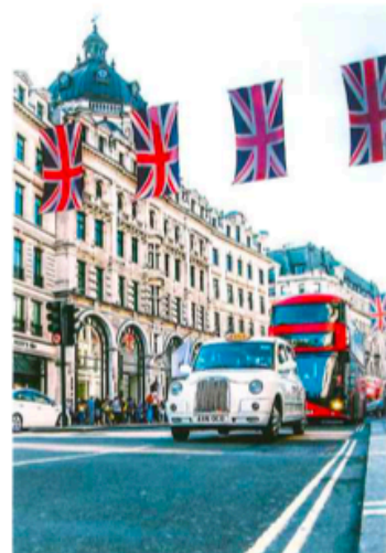
持BNO港人及其家人可以BNO「5+1」移民方案申請移民英國生活。